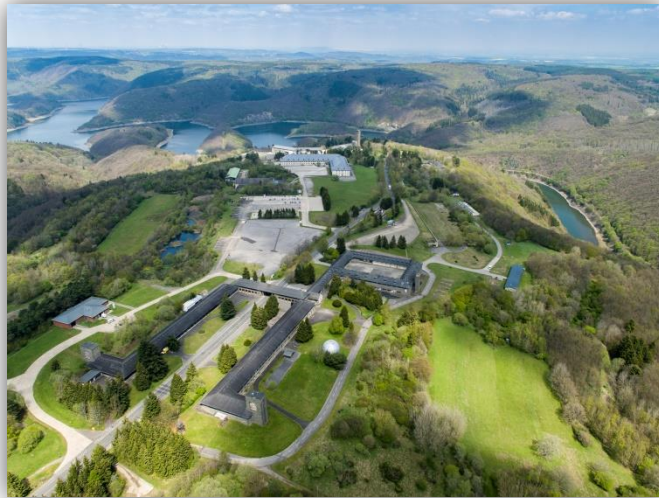
Luftbild Vogelsang